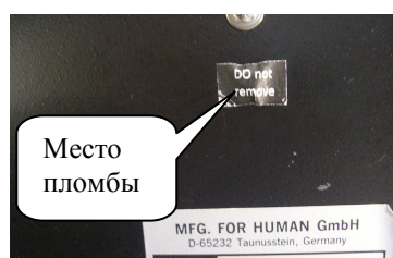
HUMAREADER SINGLE PLUS

Уровень защиты программного обеспечения от непреднамеренных и преднамеренных изменений по МИ 3286-2010: С - Метрологически значимая часть ПО СИ и измеренные данные достаточно защищены с помощью специальных средств защиты. Конструктивно анализаторы имеют защиту встроенного программного обеспечения от преднамеренных или непреднамеренных изменений, реализованную изготовителем на этапе производства путем установки системы защиты микроконтроллера от чтения и записи. Также конструкцией анализаторов предусмотрена пломбировка корпуса прибора в метлах установки винтовых соединений (Рисунок 2).