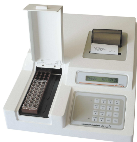
HUMAREADER SINGLE PLUS

Анализаторы иммуноферментные HUMAREADER модификаций HUMAREADER SINGLE PLUS, HUMAREADER HS представляют собой (рисунок 1) одноканальные вертикальные фотометры с многопозиционной поворотной оправкой для светофильтров в которую установлено 4 светофильтра, выделяющие рабочие длины волн. В качестве источника света использована лампа накаливания. Световой поток источника света последовательно проходит через оптическую систему с автоматически устанавливающимися фильтрами, исследуемый образец и поступает на детектор. Детектор преобразует падающий свет в электрический сигнал, который затем усиливается и обрабатывается. Для выполнения измерений могут применяться отдельные 12-ти или 8-ми луночные стрипы для HUMAREADER SINGLE PLUS и стандартные микропланшеты (до 96-ти исследуемых образцов) для HUMAREADER HS. Измерение образцов, а также обработка результатов производится в автоматическом режиме с выводом результатов измерений на встроенный дисплей и принтер (для HUMAREADER SINGLE PLUS).