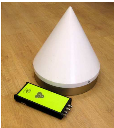
Рисунок 5 - Аппаратура навигационная двухчастотная ГЛОНАСС/GPS Legacy EGGDT_3 с БА RingAnt