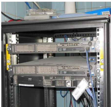
Рисунок 6 - ПЭВМ HP DL140R2 i-5130 (2GHz)/RAM 2Gb/HDD160Gb/Video 16Mb (для сбора измерений)