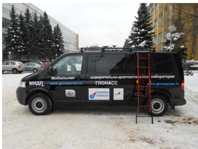
Рисунок 1 - Автомобиль Volkswagen Transporter T5

Схемы пломбировки от несанкционированного доступа составных частей лаборатории приведены на рисунке 8.