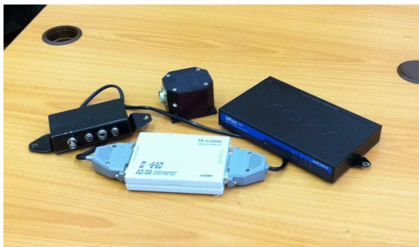
Рисунок 3 - Блок инерциальный измерительный БИ-221, аналогово-цифровой преобразователь E-440, преобразователь USB-RS-232, блок коммутации