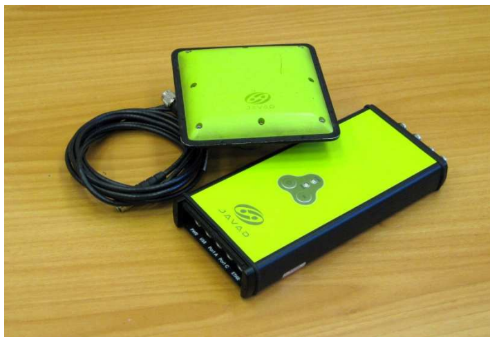
Рисунок 2 - Аппаратура навигационная двухчастотная ГЛОНАСС/GPS Legacy EURO_3 с БА Marant