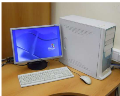
Рисунок 7 - ПЭВМ Intel® Pentium® 4CPU, 2.80 GHz, 1.00 ОЗУ (для постобработки измерительной информации)