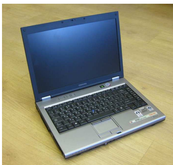
Рисунок 4 - ПЭВМ Toshiba Tecra M9