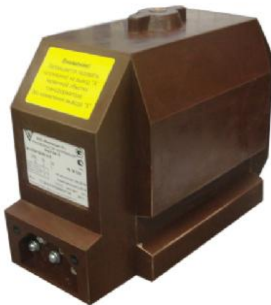
Рисунок 1. Трансформаторы напряжения ЗНОЛ-ЭК-10, ЗНОЛ-ЭК-15

Внешний вид трансформаторов напряжения ЗНОЛ-ЭК-10, ЗНОЛП-ЭК-10, ЗНОЛ-ЭК-15 представлен на рисунках 1 и 2.