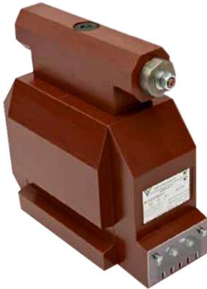
Рисунок 2. Трансформаторы напряжения ЗНОЛП-ЭК-10

Место нанесения паспортной таблички и поверительного клейма