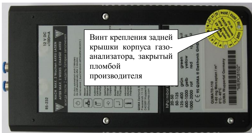
Рисунок 2 – Пломбировка корпуса от несанкционированного доступа