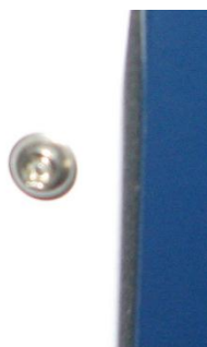
Рисунок 3 - Изображение специальных защитных винтов на задней панели прибора.

Защита прибора от несанкционированного вскрытия обеспечивается с помощью специальных винтов, фиксирующих заднюю съемную панель. Инструмент для съема винтов находится только у сертифицированных инженеров (инженеров компании производителя и инженеров официального представительства компании производителя).