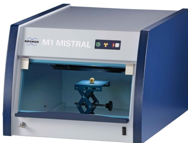
Рисунок 1 - Общий вид спектрометра микрорентгенофлуоресцентного M1 MISTRAL.

Спектрометры микрорентгенофлуоресцентные M1 ORA и M1 MISTRAL представляют собой стационарные многоцелевые, автоматизированные приборы, обеспечивающие измерение, обработку и регистрацию выходной информации (рисунки 1 и 2).