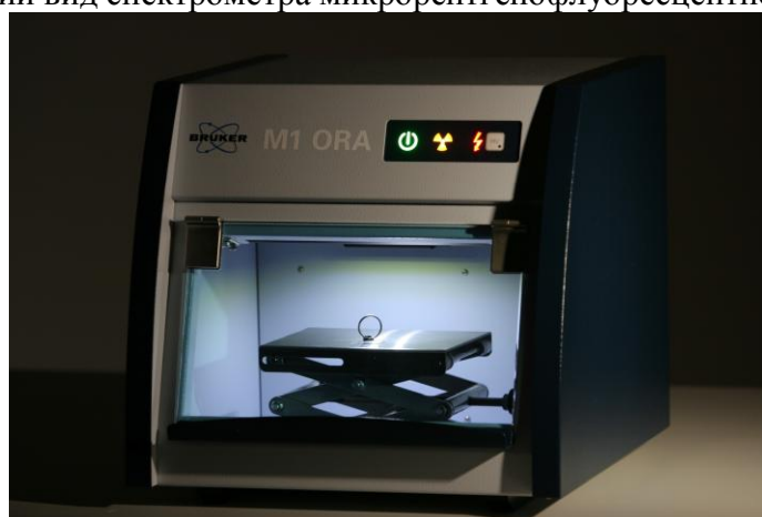
Рисунок 2 - Общий вид спектрометра микрорентгенофлуоресцентного M1 ORA.

Спектрометры состоят из непосредственно самого спектрометра, в котором размещаются: перемещающийся по трем координатам (X,Y,Z) столик (доступна версия прибора с моторизацией по одной или трем осям), рентгеновская трубка, SDD детектор (или детектор пропорционального счета), рентгеновская оптика, видео-камера, электронный блок и отдельно установленного компьютера.