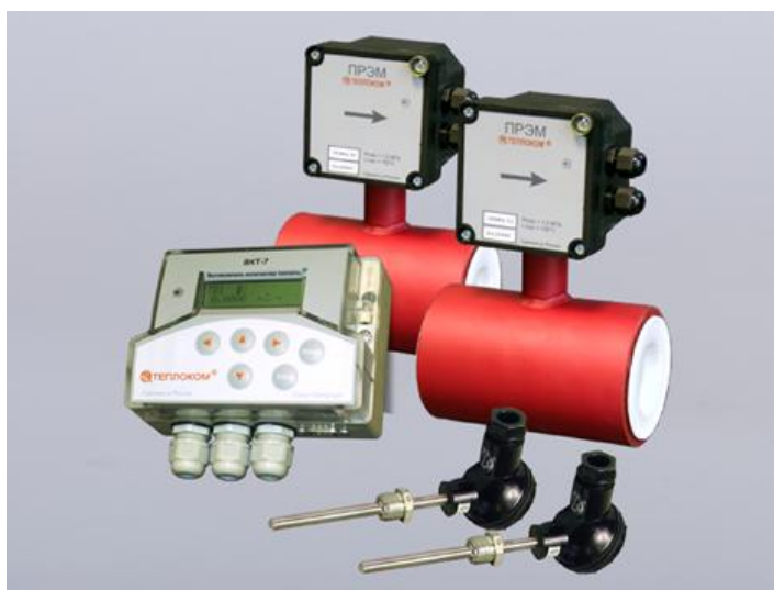
Рисунок 1 – Внешний вид теплосчетчика

Внешний вид теплосчетчика приведен на рисунке 1.