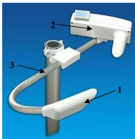
Рис.1 Нефелометры PWD Излучатель - 1, приемник - 2, кронштейн - 3,