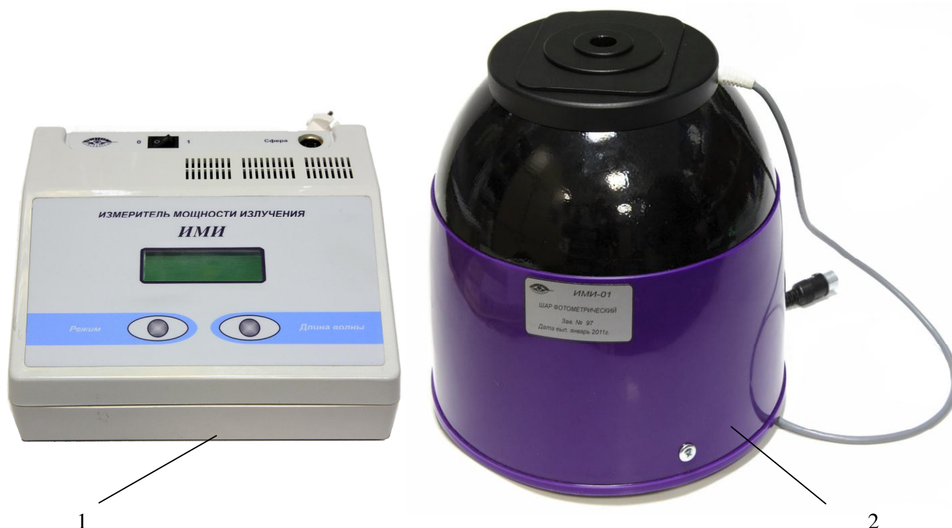
Рисунок 1 - Общий вид измерителя мощности излучения ИМИ-01 1 - блок управления; 2 – шар фотометрический.

В измерителе реализован метод «А» прямых измерений максимальной мощности в соответствии с ГОСТ 25819-83.