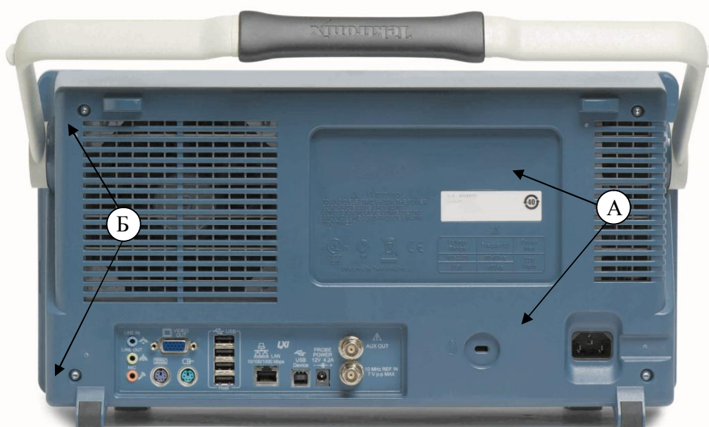
Рисунок 2 – А) Места для размещения наклеек; Б) Возможные места для пломбировки от несанкционированного доступа