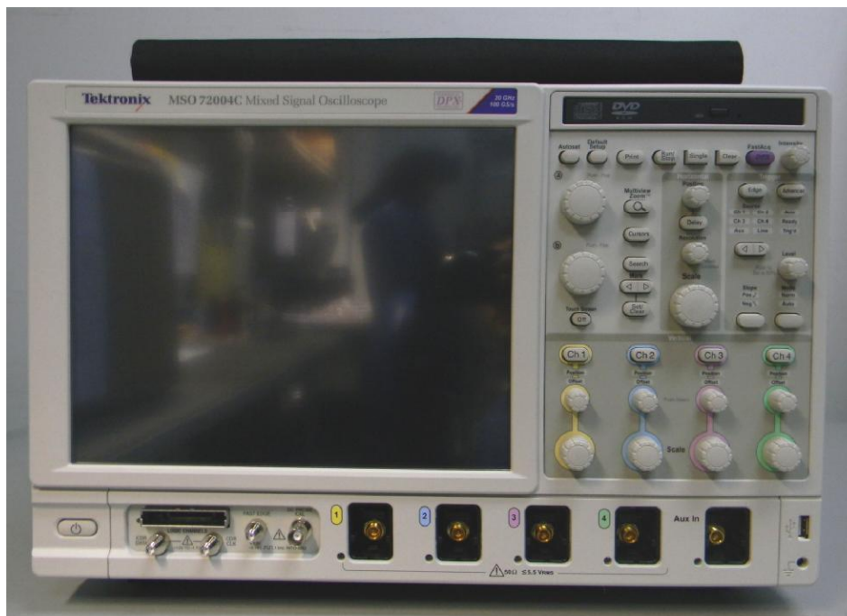
Рисунок 1 - Внешний вид осциллографа

Схема пломбировки от несанкционированного доступа и обозначение мест для размещения наклеек приведена на рисунке 2.