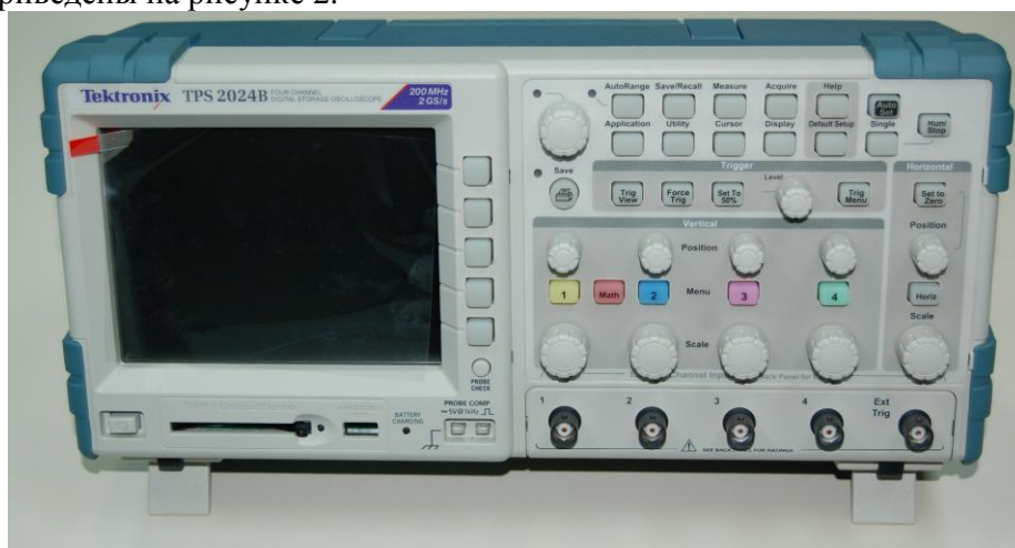
Рисунок 1. Фотография общего вида осциллографа

Схема пломбировки от несанкционированного доступа и обозначение мест для размещения наклеек приведены на рисунке 2.