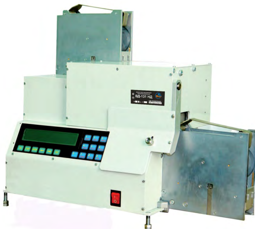
Рисунок 1 - Общий вид дефектоскопа вихретокового специализированного ВД-131НД

В состав дефектоскопа входит электронный блок, подающая кассета с роликами, подлежащими проверке, приемочный стыковой узел и лоток для забракованных роликов. В процессе измерений ролик поступает в демагнитизатор, затем на позицию контроля и по результатам проверки направляется либо в приемную кассету, либо в лоток брака.