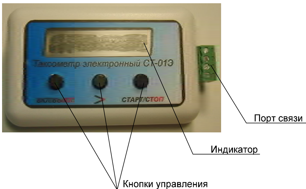
Рис.1 Общий вид таксометра

Место пломбировки таксометра для предотвращения несанкционированной настройки и вмешательства расположено на винте на задней части корпуса.