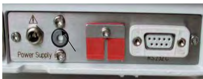
Рисунок 2 - Место нанесения поверительного клейма (в зависимости от модификации).