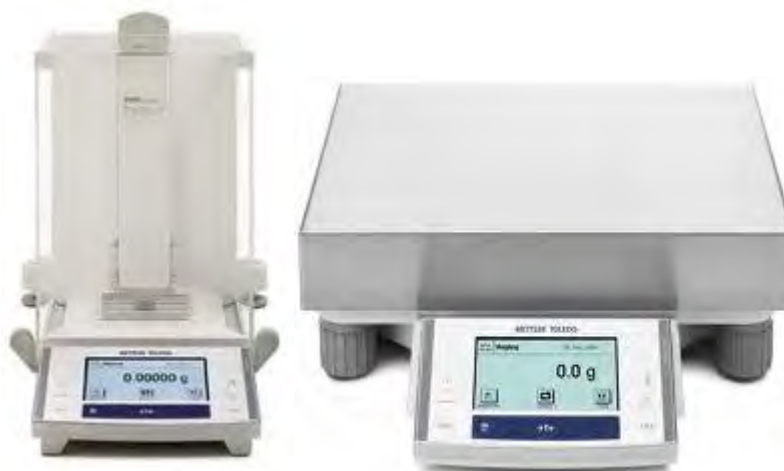
Рисунок 1 - Внешний вид весов неавтоматического действия XS.

Принцип действия весов основан на компенсации массы взвешиваемого груза электромагнитной силой, создаваемой системой автоматического уравнивания. Электрический сигнал, изменяющийся пропорционально массе взвешиваемого груза, преобразуется в цифровой код. Результаты взвешивания выводятся на дисплей.