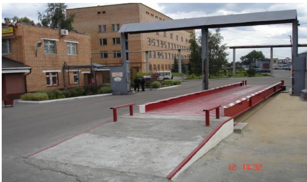
Рисунок 6 Весы стационарные электронные BC-30A-(C16A, ЭТА-01)