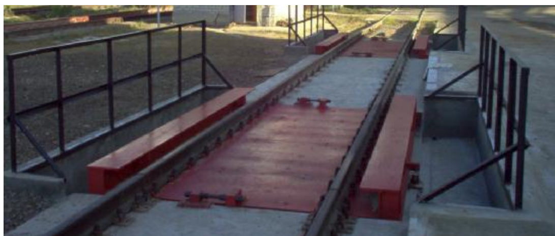
Рисунок 7 Весы стационарные электронные BC-150ВД-(МВ-150, ЭТА-01)