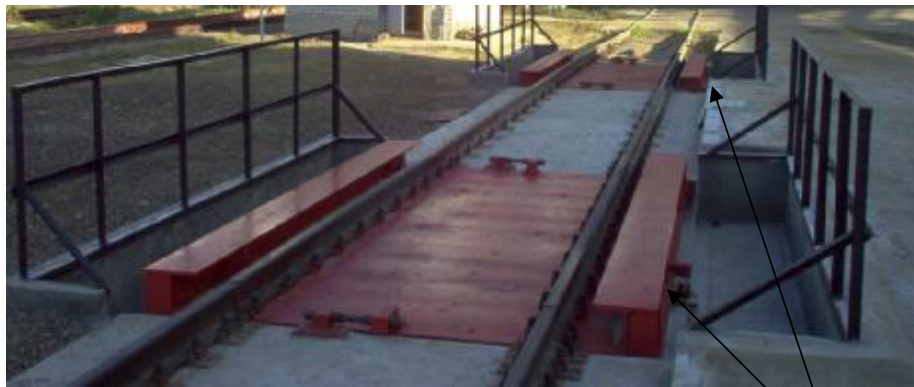
Рисунок 8 Маркировка весов стационарных электронных ВС-30А-(С16А, ЭТА-01)

ООО "НПО "Эталон Тензо" ВС-150ВД-(МВ-150,ЭТА-01) Max. 150 т Min. 1 т -30°С/+40°С e 50 кг №версии ПО: 00009.0 №10819 Сделано в России 2010 г.