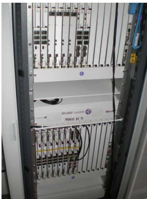
Рисунок 1- общий вид оборудования с открытой дверью

Общий вид оборудования и схема пломбировки от несанкционированного доступа, представлены на рисунках 1 и 2.