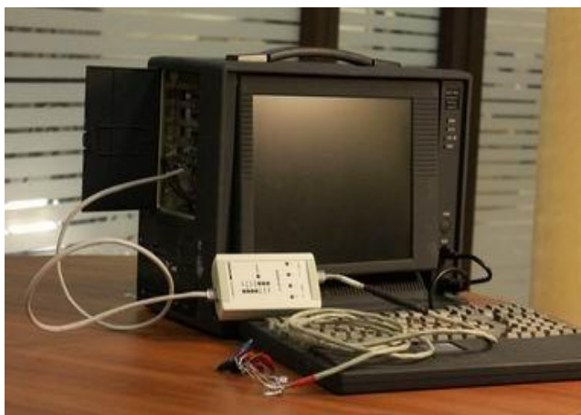
Рисунок 1 Общий вид оборудования

На рис. 1 изображен внешний вид оборудования SNT-7531, на рис. 2 - вид защитной наклейки на корпусе компьютера, при попытке её снятия.