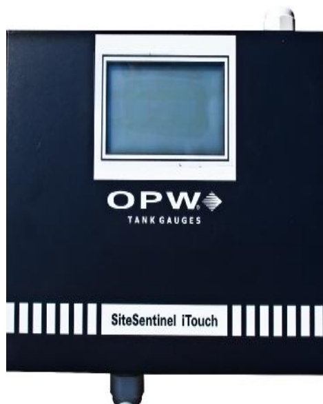
Рис.3. Контроллер для приема и обработки выходных сигналов первичных преобразователей "OPW SiteSentinel"

Выходные сигналы первичных преобразователей, пропорциональные уровню, температуре, плотности нефтепродукта и уровню подтоварной воды (блок первичных преобразователей 924В) или пропорциональные уровню, температуре нефтепродукта и уровню подтоварной воды (блок первичных преобразователей AST7100) в резервуаре по кабельным линиям связи по протоколу RS485 передаются на контроллер для приема и обработки выходных сигналов первичных преобразователей "OPW SiteSentinel" (Рис.3).