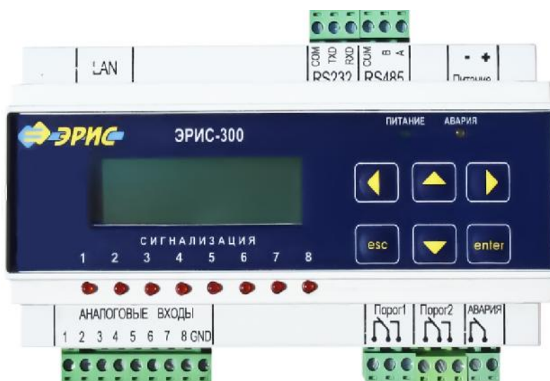
Рис.4. Контроллер для вычислений объема и массы нефтепродуктов "Эрис 300"

Контроллер "OPW SiteSentinel" обрабатывает полученную измерительную информацию и передает данные по кабельным линиям связи по протоколу RS232 на контроллер для вычислений объема и массы нефтепродуктов "Эрис 300". Контроллер "Эрис 300" (Рис.4) использует полученную измерительную информацию и внесенные в память контроллера данные градуировочных таблиц на соответствующие резервуары рассчитывает текущие значения объема и массы нефтепродукта в резервуаре и передает полученные результаты по кабельным линиям связи по протоколу RS232 на компьютер верхнего уровня оператора АЗС или нефтебазы.