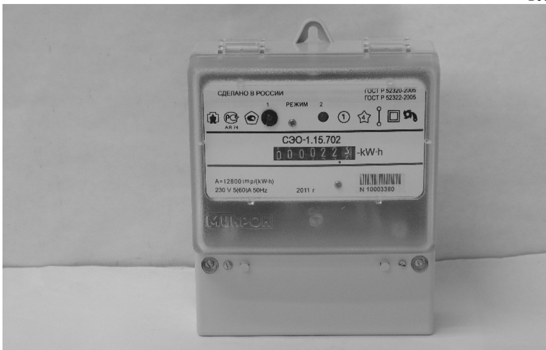
Рисунок 2 – Внешний вид счетчиков СЭО-1.15.702 и СЭО-1.15.702/1 с закрытой крышкой клеммной колодки