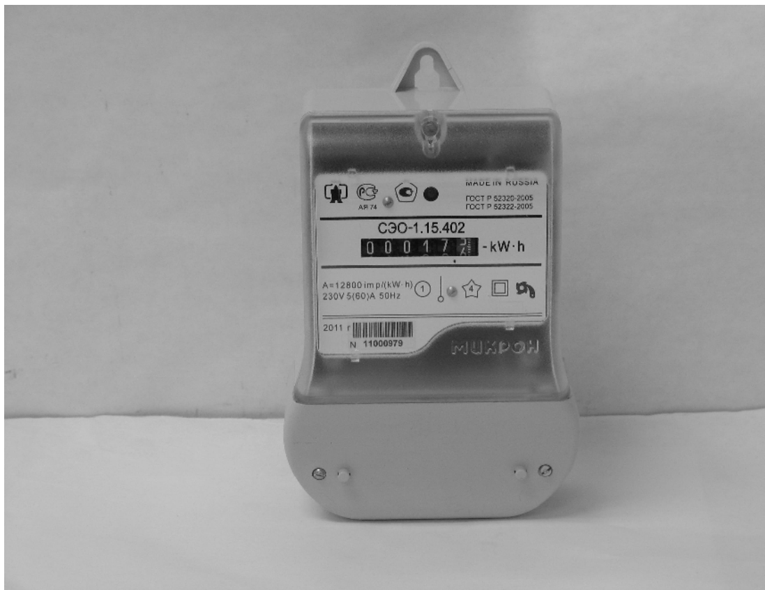
Рисунок 1 – Внешний вид счетчиков СЭО-1.15.402, СЭО-1.15.502, СЭО-1.15.402/1, СЭО-1.15.502/1 с закрытой крышкой клеммной колодки

Внешний вид счетчиков СЭО-1.15 с закрытой крышкой клеммной колодки и схемы опломбирования приведены на рисунках 1 - 5.