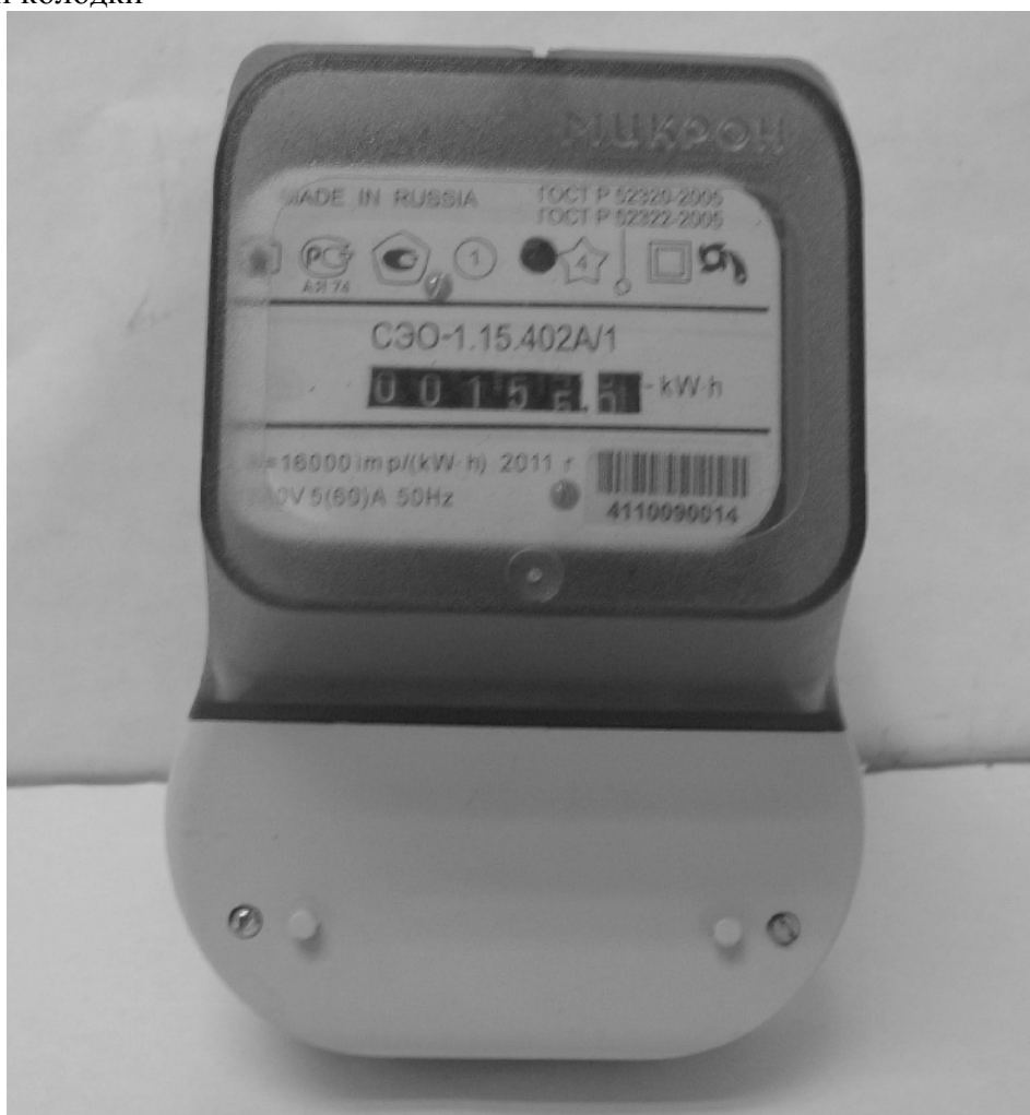
Рисунок 3 – Внешний вид счетчиков СЭО-1.15.402А, СЭО-1.15.502А, СЭО-1.15.402А/1, СЭО-1.15.502А/1 с закрытой крышкой клеммной колодки