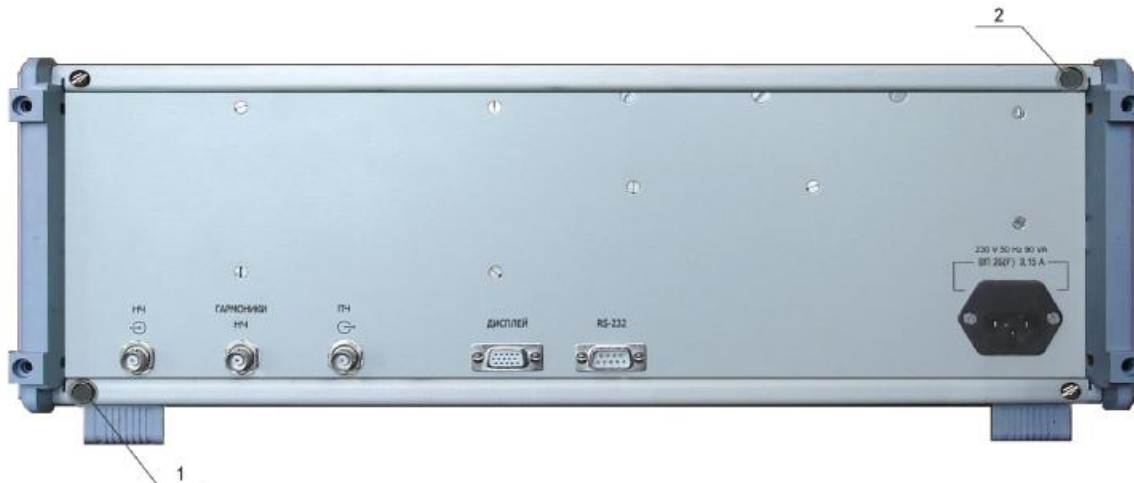
Рисунок 2 - Схема пломбировки прибора

Схема пломбировки от несанкционированного доступа приведена на рис 2. Позиции 1; 2 на схеме - места для нанесения оттисков клейм.