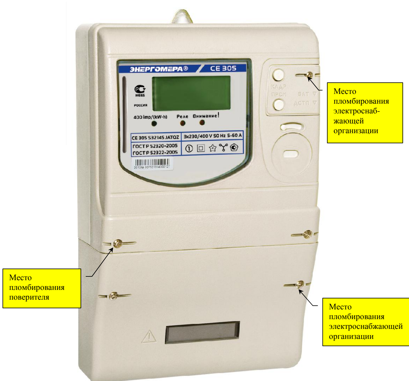
Рисунок 2 - Общий вид счётчика CE 305

Фотография общего вида счётчика, с указанием схемы пломбировки от несанкционированного доступа, приведена на рисунке 2.