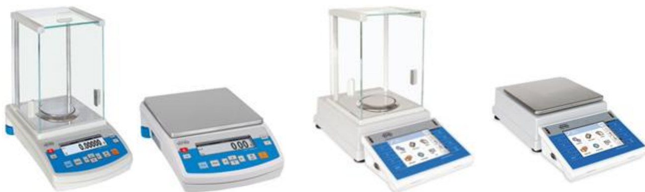
Рисунок 3 – Общий вид весов с графическим дисплеем и с сенсорным дисплеем.