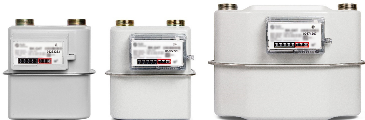
Рисунок 1 – Общий вид основных исполнений