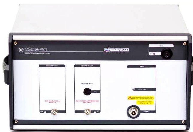
X5M-18/3 и X5M-18/4