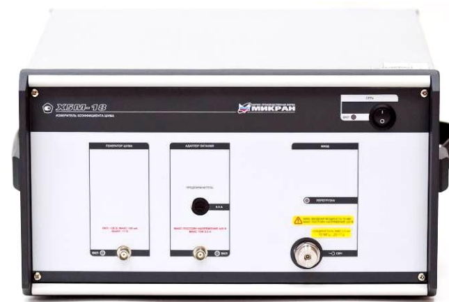
X5M-18/7 и X5M-18/8