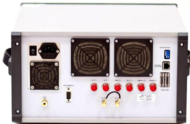
Рисунок 2 - Внешний вид задней панели измерителя