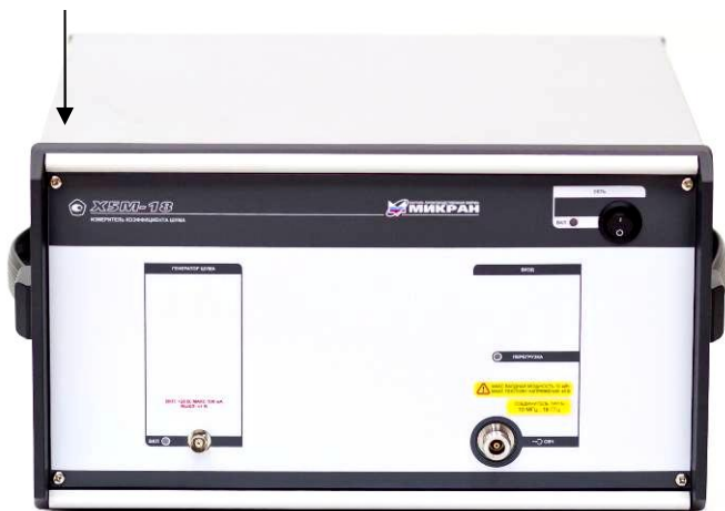
X5M-18/1 и X5M-18/2

Место нанесения знака об утверждении типа