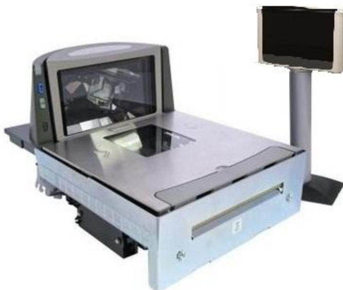
Рисунок 1 - Общий вид весов SC-900-15, SC-900-6/15

Конструктивно весы состоят из грузоприемного и весоизмерительного устройства, терминала, цифрового дисплея со встроенным блоком клавиатуры. Обозначение модификации записывается в следующем виде: SC-900-А; SC-900-В/А, где А-максимальная нагрузка, В-часть диапазона многоинтервальных весов.