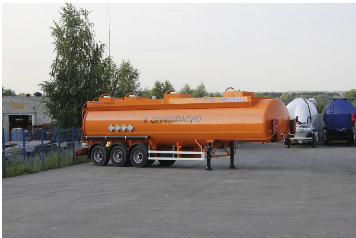
Рисунок 1 - Общий вид полуприцепов – цистерн