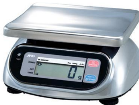
Рисунок 1 - Общий вид весов SK-WP

Общий вид весов представлен на рисунке 1.