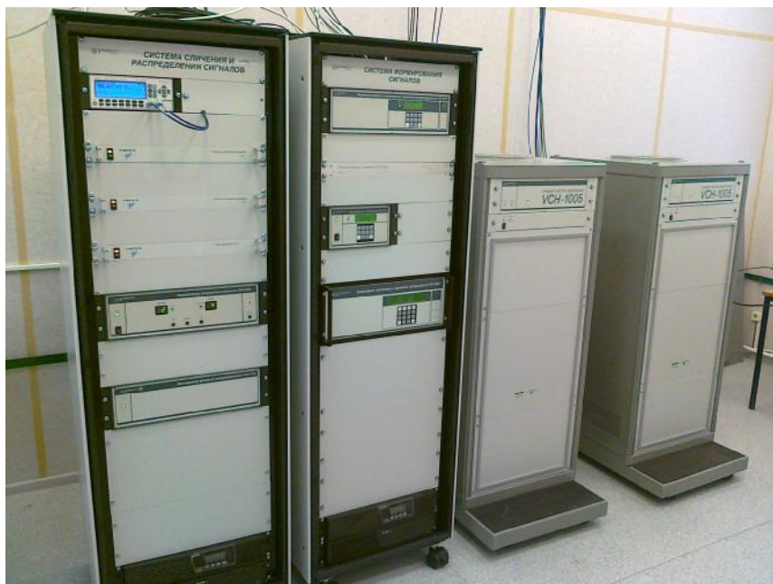
Рисунок 1 - Рабочий эталон единиц времени и частоты VCH-015 ЯКУР.411735.007

Внешний вид эталона приведен на рисунке 1.