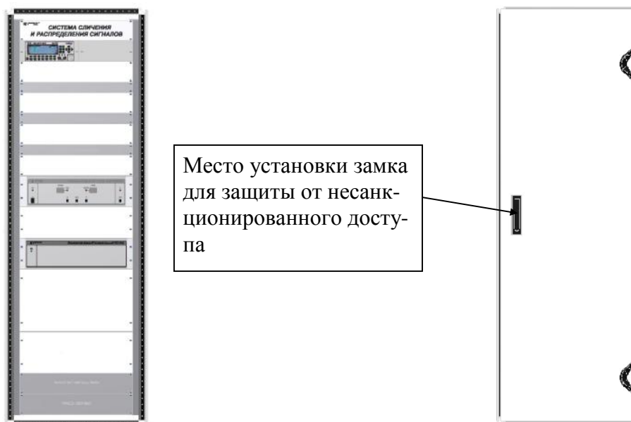
Рисунок 4 - Стойка система сличения и распределения сигналов