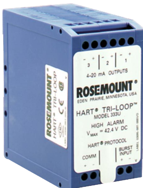
Рисунок 1 – Фотография общего вида

Фотография общего вида преобразователя приведена на рисунке 1.