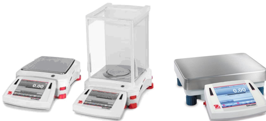
Рисунок 1 – Общий вид весов неавтоматического действия Explorer

Принцип действия весов основан на компенсации массы взвешиваемого груза электромагнитной силой, создаваемой системой автоматического уравнивания. Электрический сигнал, изменяющийся пропорционально массе взвешиваемого груза, преобразуется в цифровой код. Результаты взвешивания выводятся на дисплей.