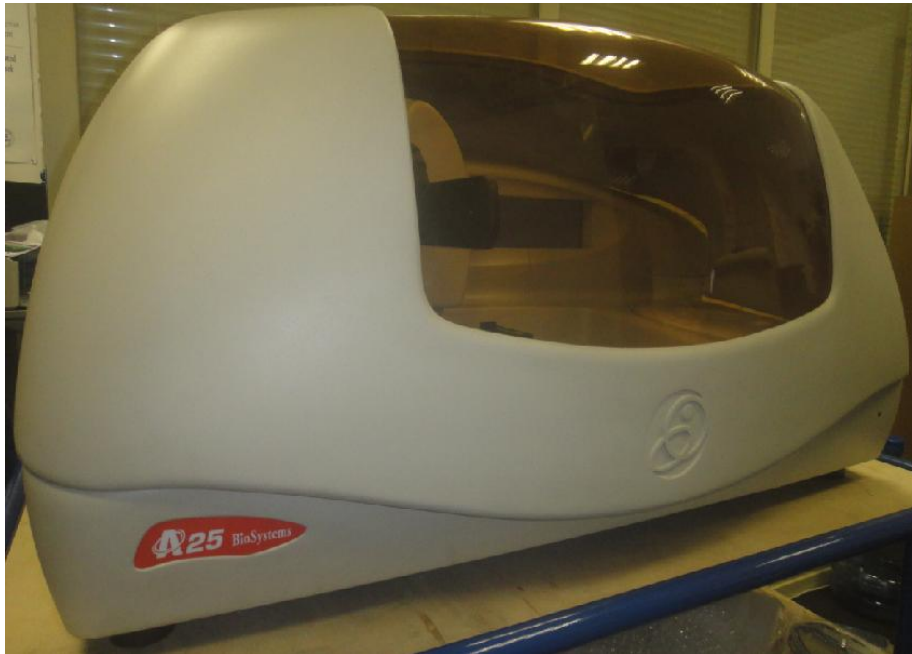
Рисунок 2 – Общий вид анализатора Random Access A-25