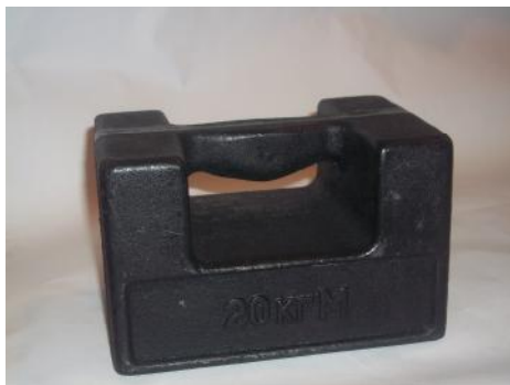
Рис. 1 – Общий вид гири

Гиря имеет форму параллелепипеда с выемкой в верхней части. Боковые стенки выемки соединены перемычкой, служащей ручкой. Гиря изготовлена из серого чугуна. Общий вид гири представлен на рис.1. Гиря имеет подгоночную полость, заполненную технической дробью из чугуна по ГОСТ 11964, и закрытую резьбовой стальной пробкой, фиксированной закрепительным штифтом из алюминиевого сплава, на который наносится поверительное клеймо. Место пломбировки гири указано стрелкой на рис. 2.