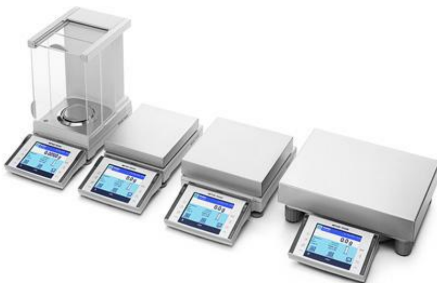
Рисунок 1 – Общий вид весов неавтоматического действия ХР.

Принцип действия весов основан на компенсации массы взвешиваемого груза электромагнитной силой, создаваемой системой автоматического уравнивания. Электрический сигнал, изменяющийся пропорционально массе взвешиваемого груза, преобразуется в цифровой код и результаты взвешивания выводятся на дисплей.