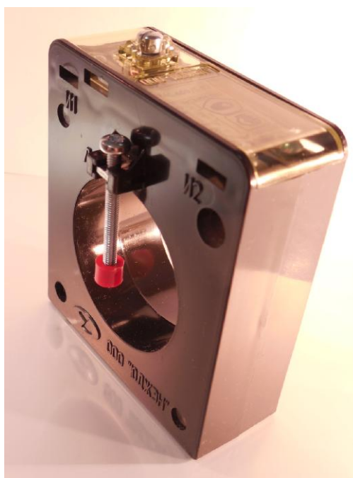
Рисунок 1 - Внешний вид трансформаторов тока измерительных ТПП-Н-0,66

Внешний вид трансформаторов с указанием мест знака поверки и местами пломбирования представлены на рисунках 1 и 2.