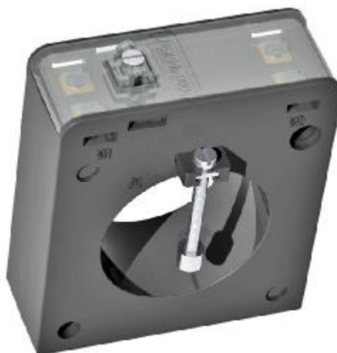
Рисунок 1 – Внешний вид трансформаторов

Схема пломбировки от несанкционированного доступа и обозначение места нанесения знака поверки приведены на рисунке 2.