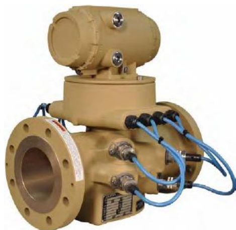
УПР модели 3814

Блок электроники вырабатывает электрические импульсы, которые поступают на трансдюсеры, обрабатывает сигналы с трансдюсеров, а также формирует их в цифровом, частотном и аналоговом видах. Блок электроники оснащен одним последовательным портом RS-232/485 (Modbus RTU/ASCII), одним портом Ethernet (TCP/IP) 10 BaseT, тремя частотными, двумя аналоговыми выходами, а также одним цифровым и двумя аналоговыми входами для преобразователей температуры и давления.