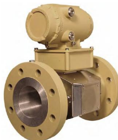
УПР модели 3812