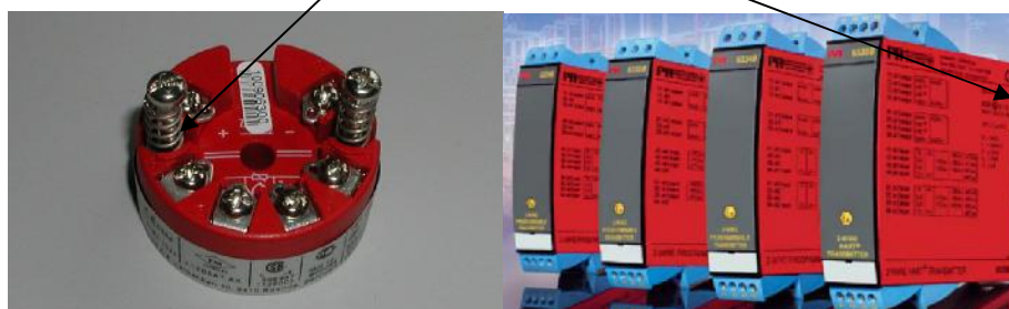
Рис.3 Внешний вид преобразователей измерительных PR серии 6.