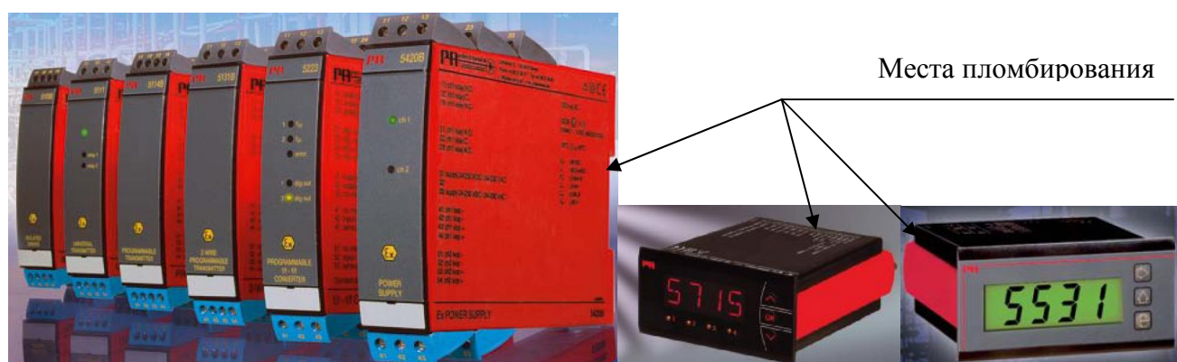
Рис.2 Внешний вид преобразователей измерительных PR серии 5.