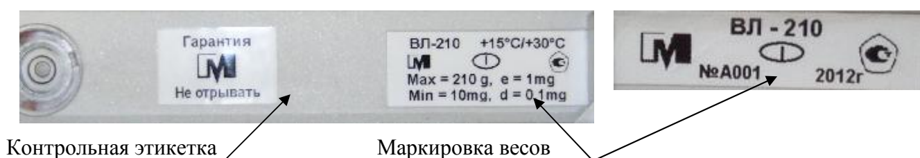
Рисунок 2 – Схема пломбирования от несанкционированного доступа и маркировка весов

Маркировка весов выполняется на двух табличках (рисунок 2) и содержит следующие сведения: