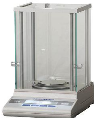
Рисунок 1 – Общий вид весов