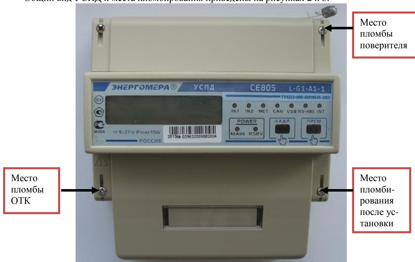
Рисунок 2 – Общий вид и места пломбирования УСПД модификаций CE805 X-XX-XX-1

Общий вид УСПД и места пломбирования приведены на рисунках 2 и 3.