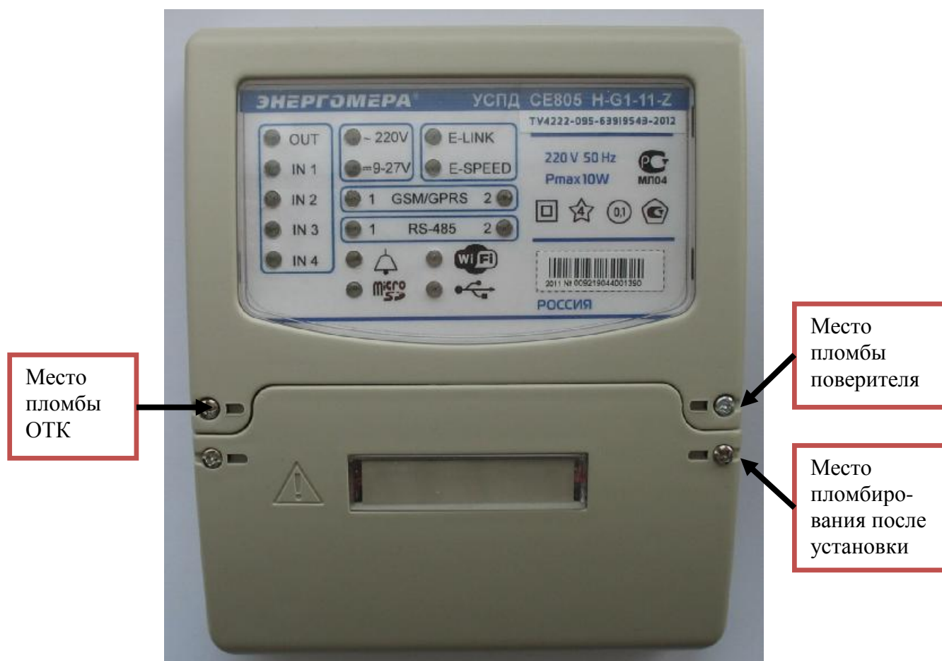
Рисунок 3 – Общий вид и места пломбования УСПД модификаций CE805 X-XX-XX-Z