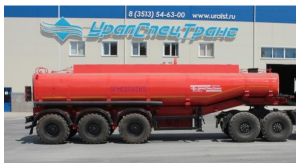
Рисунок 1 – ППЦ с одним отсеком

Внешний вид ППЦ представлен на рисунке 1, 2. Место пломбирования обозначено на рисунке 3, 4 и 5.