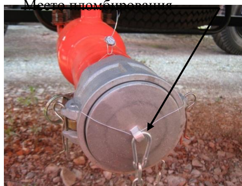
Рисунок 5 – Ручка открывания технологического отсека, или Заглушка открывания трубопровода слива топлива из ППЦ (в зависимости от конструктивного исполнения)