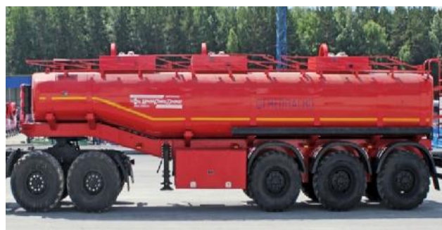
Рисунок 2 – ППЦ с тремя отсеками