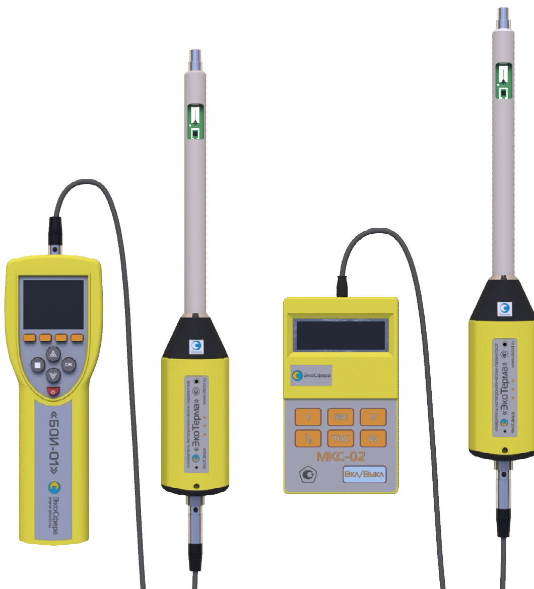
Рисунок 1. Внешний вид станций «ЭкоТерма» (исполнение «ЭкоТерма-01» - слева, исполнение «ЭкоТерма-02» - справа).

Исполнения станций «ЭкоТерма» не отличаются по набору измеряемых параметров, при этом в исполнении «ЭкоТерма-01», помимо параметров для которых необходим «черный шар», блоком индикации отображаются температура точки росы и температура влажного шарика термометра.