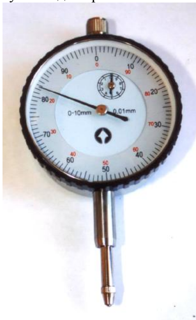
Рисунок 1 – Общий вид индикаторов часового типа с ценой деления 0,01 мм Diarazon.

Индикаторы выпускаются с ушком для крепления или без него.