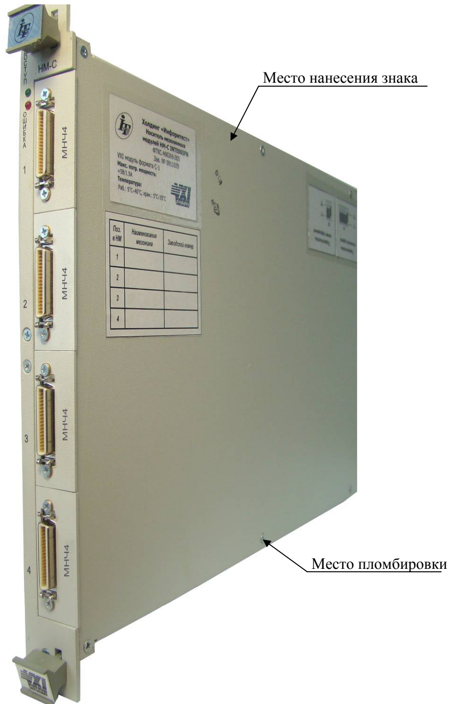
Рисунок 3 – Внешний вид носителя мезонинных модулей типа НМ (НМ-С, НМУ) с установленными измерителями частоты сигналов, указанием места нанесения знака утверждения типа и местом пломбировки