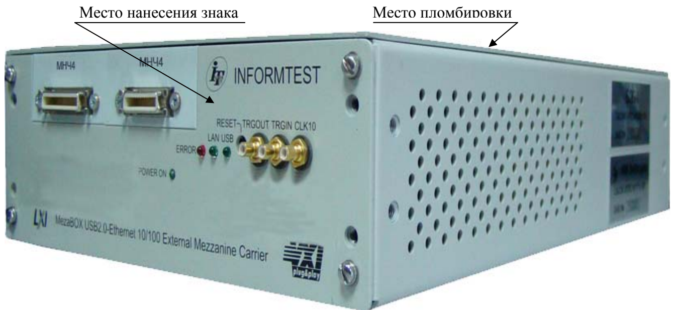
Рисунок 1 – Внешний вид устройства MezaBox с установленными измерителями частоты сигналов, указанием места нанесения знака утверждения типа и местом пломбировки