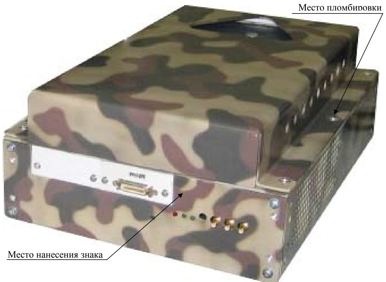
Рисунок 2 – Внешний вид устройства MezaBox\Battery 133W-hrs с установленным измерителем частоты сигналов, указанием места нанесения знака утверждения типа и местом пломбировки