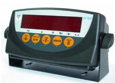
VT 100 - вид спереди

Общий вид индикаторов VT 100 и DIS2116 и схемы их пломбирования представлены на рисунке 3.