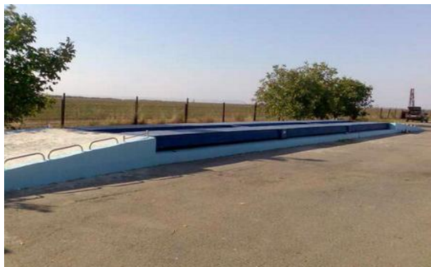
Рисунок 1 - Установка ГПУ весов на поверхности дорожного полотна