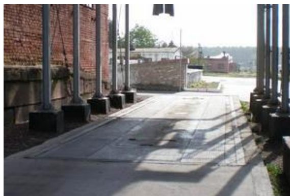
Рисунок 2 – Установка ГПУ весов в приямок

Общий вид индикаторов VT 100 и DIS2116 и схемы их пломбирования представлены на рисунке 3.