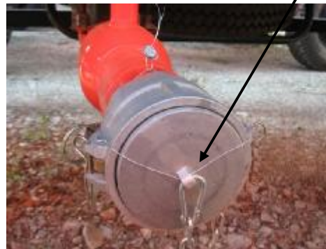
Рисунок 6 – Ручка открывания технологического отсека, или Заглушка открывания трубопровода слива топлива из ППЦ (в зависимости от конструктивного исполнения)