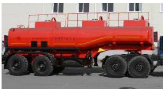
Рисунок 3 – ППЦ с тремя отсеками