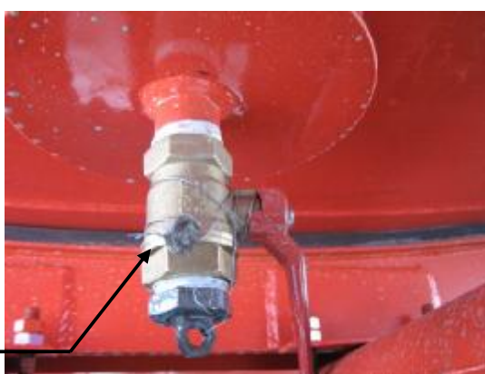
Рисунок 5 – Кран слива отстоя из ППЦ