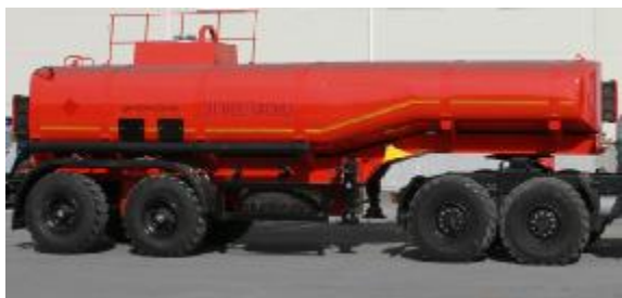
Рисунок 1 – ППЦ с одним отсеком

Внешний вид ППЦ представлен на рисунке 1, 2, 3. Место пломбирования обозначено на рисунке 4, 5 и 6.