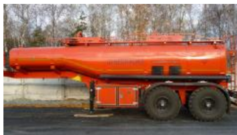
Рисунок 2 – ППЦ с двумя отсеками