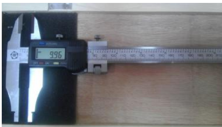
Рисунок 5. Общий вид штангенциркулей типа ШЦЦ-II.