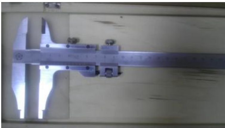
Рисунок 4 - Общий вид штангенциркулей типа ШЦ-II.