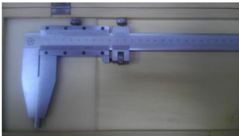
Рисунок 6. Общий вид штангенциркулей типа ШЦ-III.