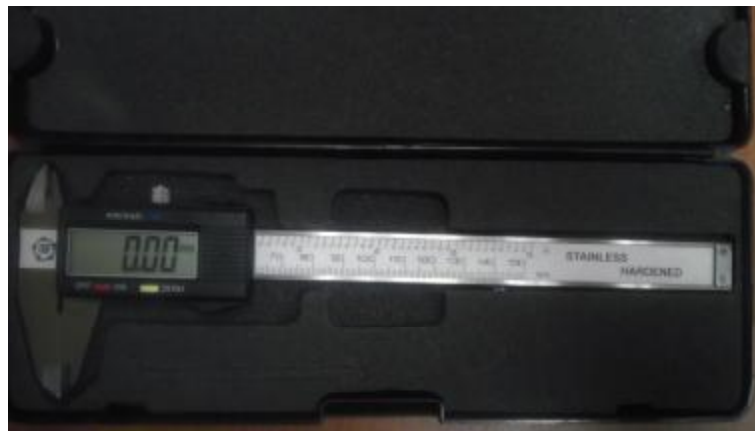
Рисунок 3 - Общий вид штангенциркулей типа ШЦЦ-I.