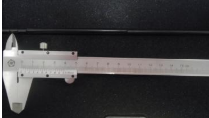
Рисунок 1 - Общий вид штангенциркулей типа ШЦ-I.