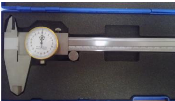
Рисунок 2 - Общий вид штангенциркулей типа ШЦК-I.