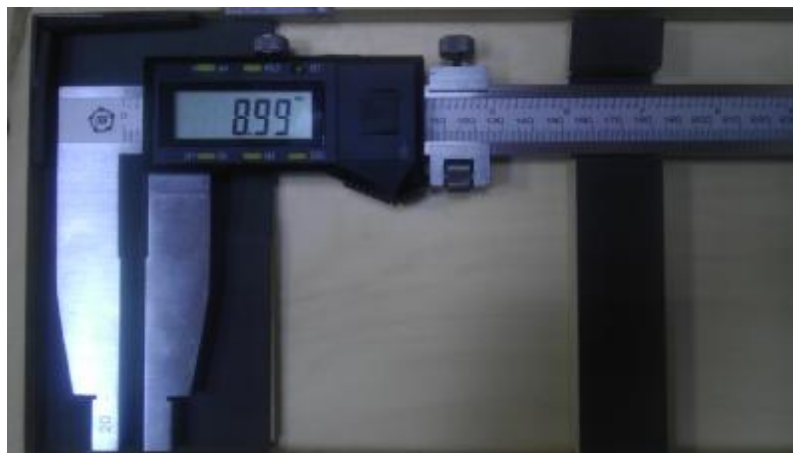
Рисунок 7. Общий вид штангенциркулей типа ШЦЦ-Ш.