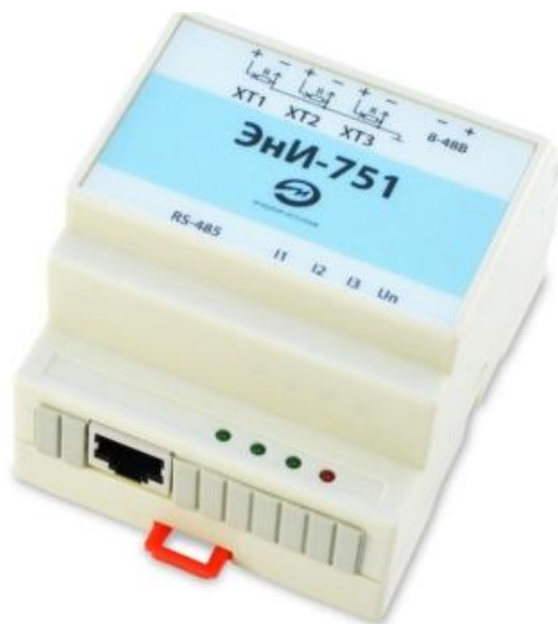
Рисунок 1 - Общий вид ЭНИ-751

Уровень защиты программного обеспечения от непреднамеренных и преднамеренных изменений - А (в соответствии с МИ 3286-2010). Защита от несанкционированного доступа к ПО и измерительным компонентам ЭНИ-751 обеспечивается нанесением пломбы на корпус ЭНИ-751. Пломба представляет собой саморазрушающуюся наклейку, которая наносится в месте соприкосновения основания и крышки корпуса ЭНИ-751. Схема пломбировки от несанкционированного доступа представлена на рисунке 2.