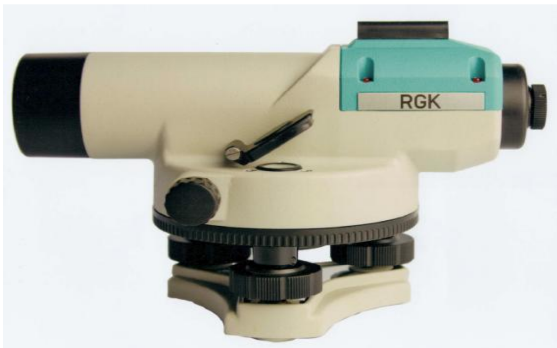
Рисунок 1 - Внешний вид нивелира

Схема пломбировки от несанкционированного доступа приведена на рисунке 5.