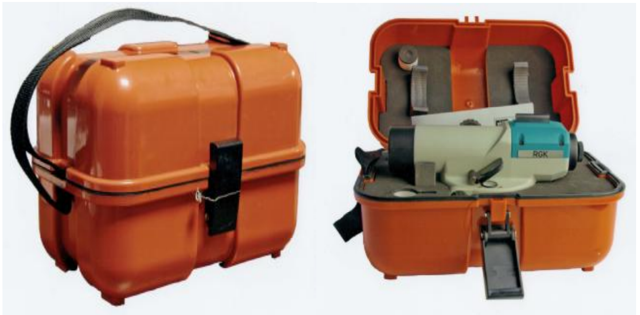
Рисунок 4 - Внешний вид транспортировочного кейса и схема размещения нивелира в транспортировочном кейсе