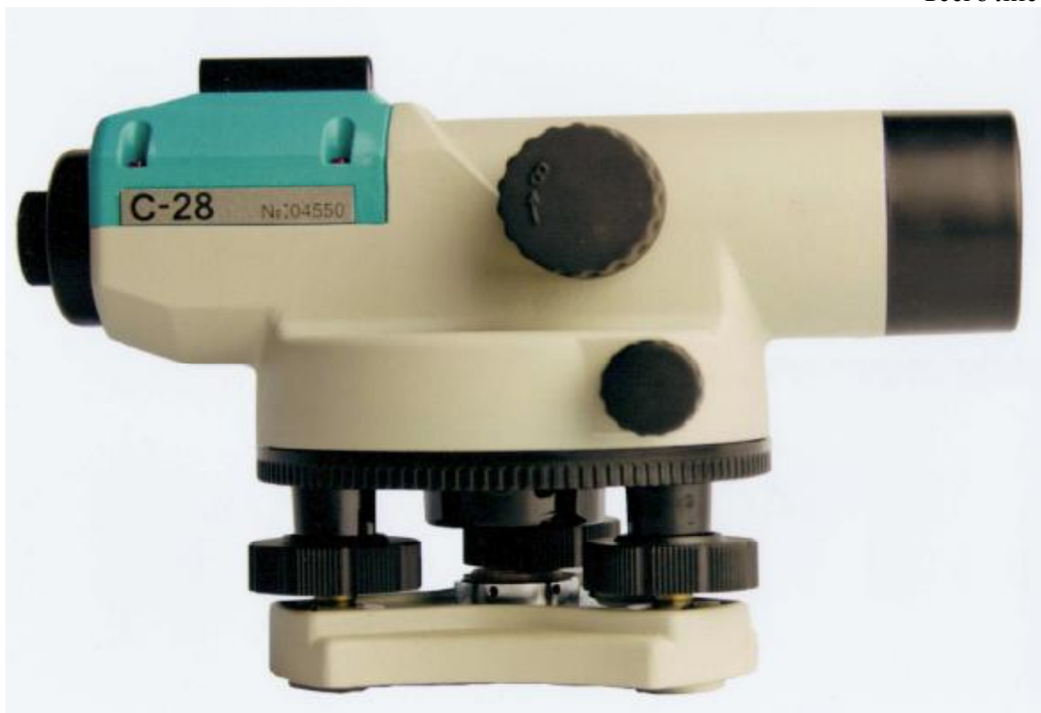
Рисунок 2 - Внешний вид нивелира