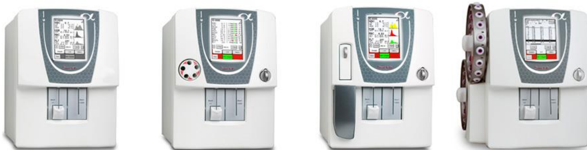
Рисунок 1. Внешний вид анализаторов гематологических Swelab Alfa моделей Basic, Standard, Auto Sampler, Cap Piercer

Модели анализаторов отличаются дизайном и производительностью.