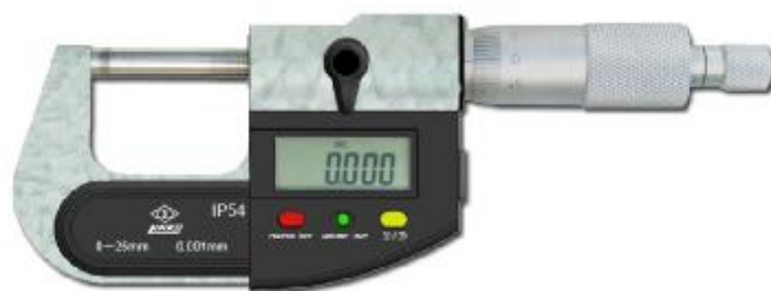
Рисунок 5 - Общий вид микрометров гладких серии 727 исполнение I