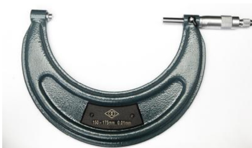
Рисунок 3 - Общий вид микрометров гладких серий 703 и 703А