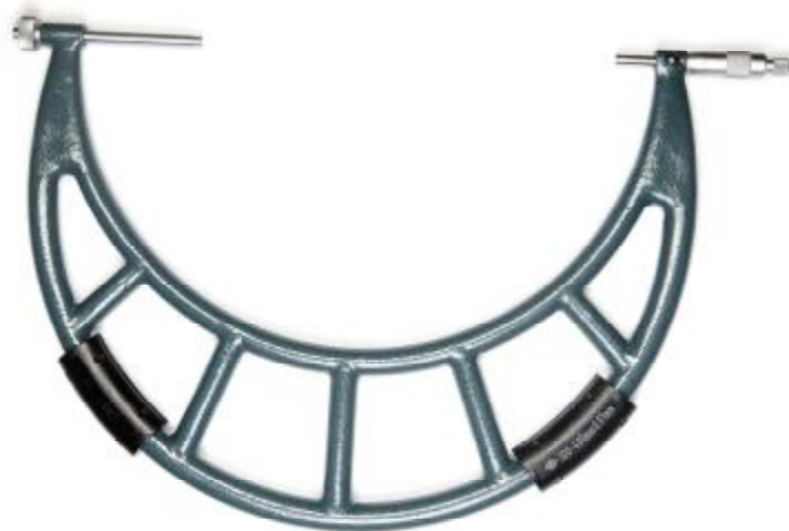
Рисунок 4 - Общий вид микрометров гладких серии 704