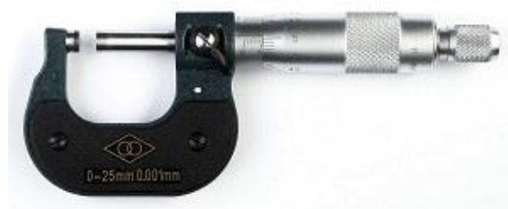
Рисунок 2 - Общий вид микрометров гладких серии 702