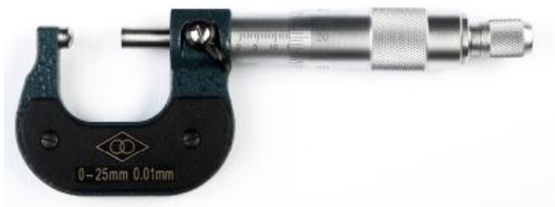
Рисунок 1 - Общий вид микрометров гладких серии 701