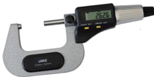
Рисунок 6 - Общий вид микрометров гладких серии 727 исполнение II